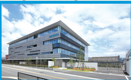
タツタ電線株式会社 本社