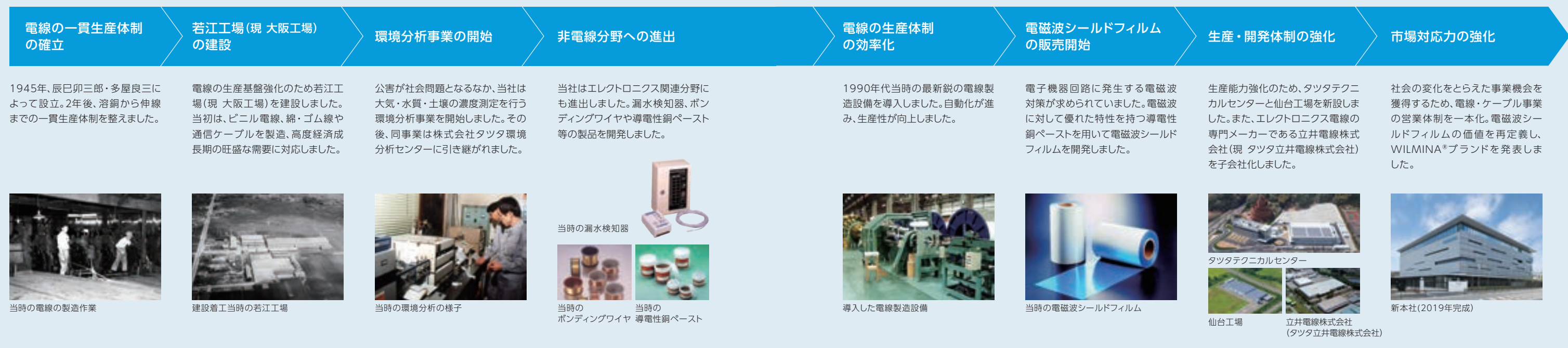
当時の電線の製造作業